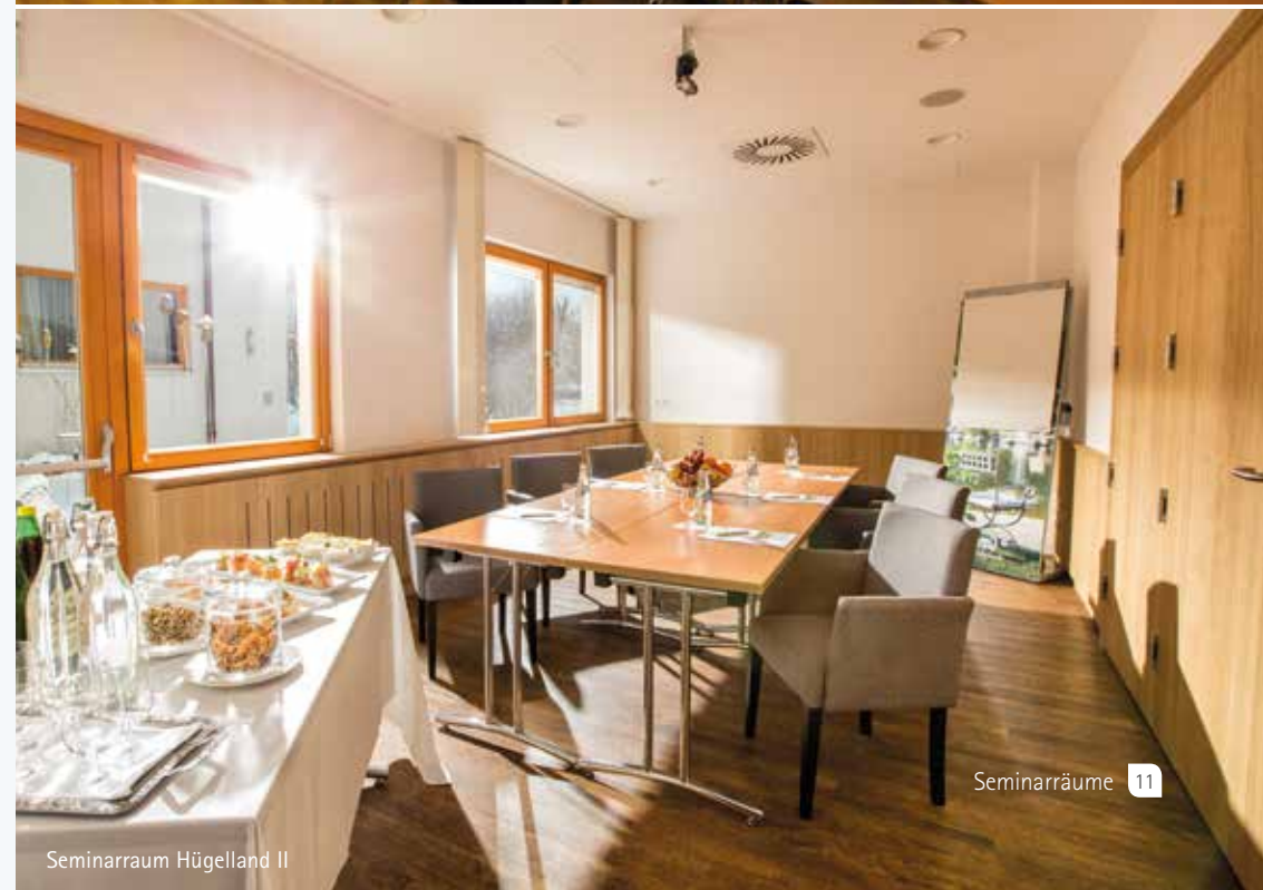
Seminarraum Hügelland II