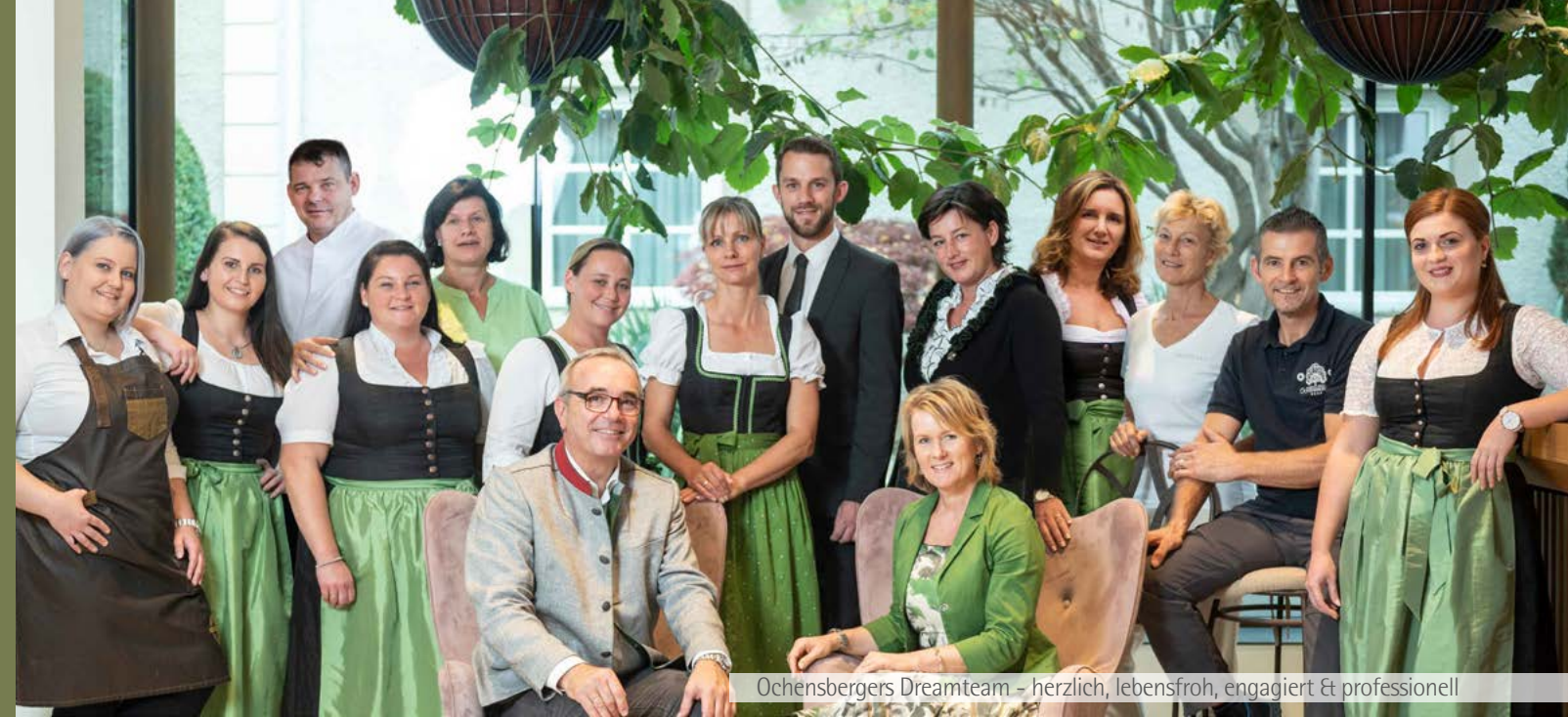
Ochensbergers Dreamteam - herzlich, lebensfroh, engagiert & professionell